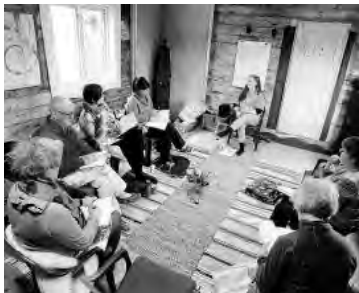
FORELESNING: Noe av kurset er basert på undervisning inne som forelesninger. Lokalet befinner seg i et naust, som er under stadig restaurering.