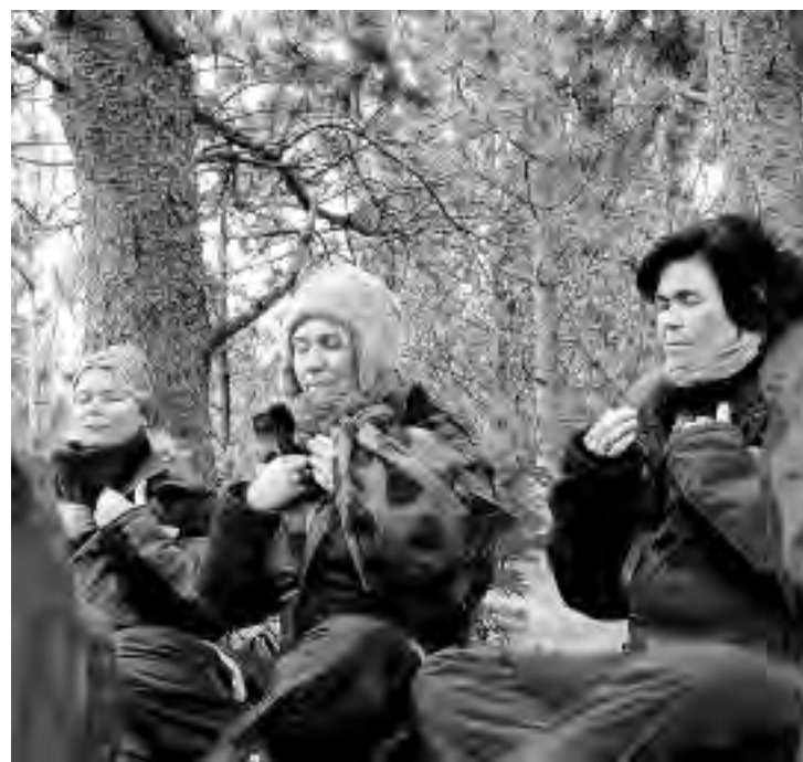
KONTAKT: Innledende tromming med fingrene stimulerer thymus øverst i brystet, og fører til bedre kontakt med pusten og prosessene under den kommende meditasjon.