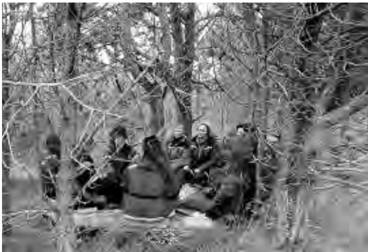
VIKTIG TRE: Det dekorerte treet har en plattform rundt, der en del av undervisning og instruksjon foregår.