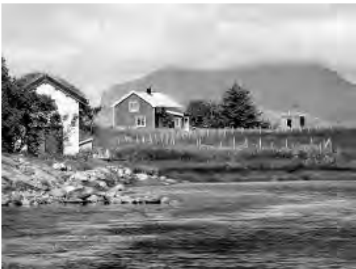
GÅRDEN: Buøyen kursgård ved Austbø.

Kurset på Buøyen kursgård (ikke Buøyen Kursgård) denne uka var et fordypningskurs med åtte deltakere, hvorav en mann. Som regel er fjerdedelen menn. Iliana akademiet gir fagutdannelse i livsveiledning, og alle deltakerne disse regntunge dagene var ferdig utdannet, eller i ferd med å bli det. Derfor var denne samlingen primært for dem selv,