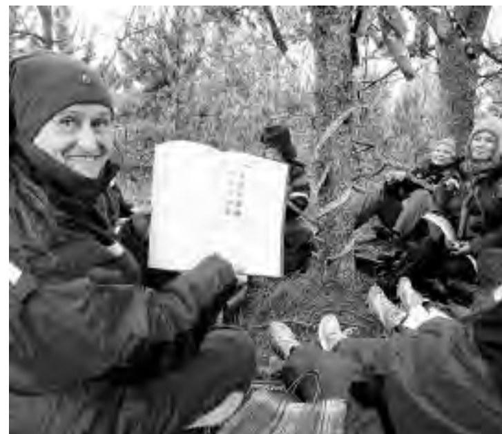
MEDITASJON: Her er dagens farger som skal danne utgangspunkt for to timers stille meditasjon i skogen. Deltakerne sitter hver for seg under denne prosessen.